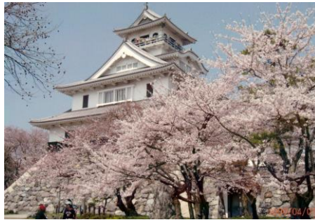
秀吉のつくった出世城・長浜城