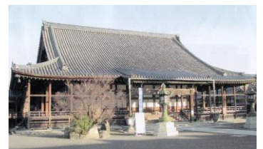
長浜御坊・大通寺