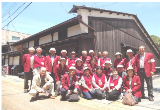
私たちがご案内します