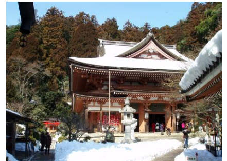
信仰の島・竹生島（弁天堂）