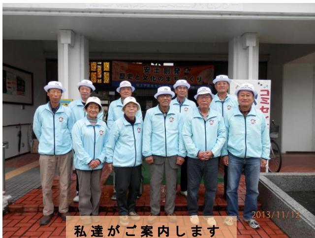
私達のご案内します

JR安土駅→桑實寺→観音寺城跡→観音正寺 → { 三角点→瑠璃石→文芸の郷→JR安土駅 表参道→教林坊→石寺→JR安土駅