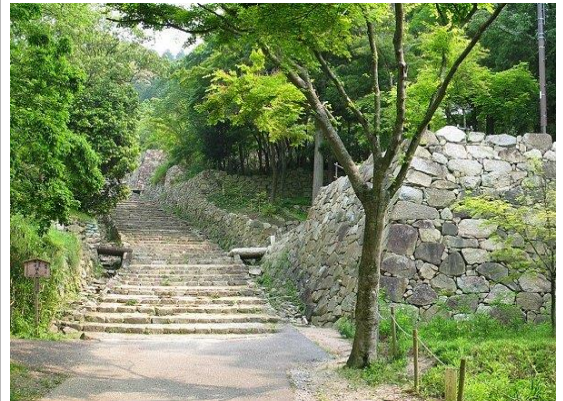
新緑の安土城大手