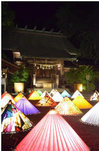
和傘のイルミネーション (イメージ)