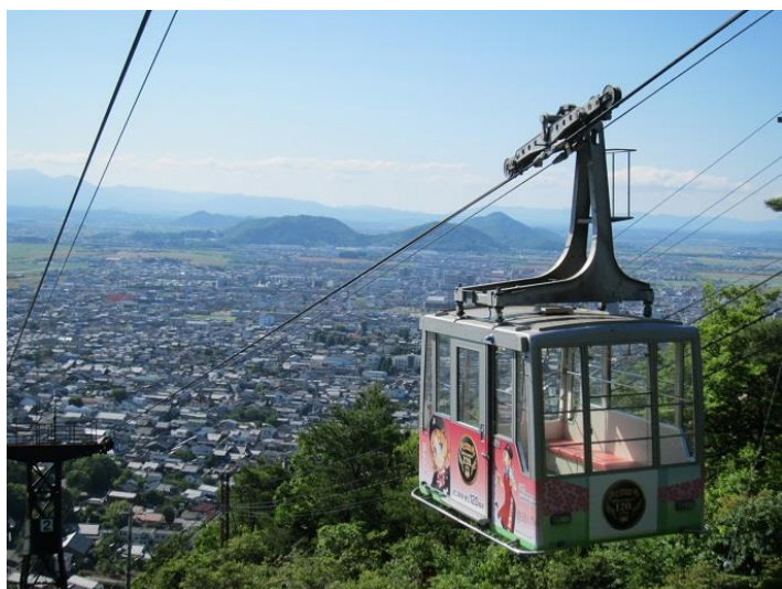
八幡山ロープウェー

http://www.ohmitetudo.co.jp/hachimanyama/yuusuzumi2019/index.html