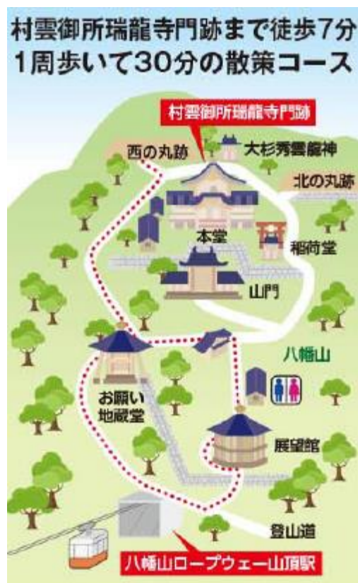
ライトアップ散策コース