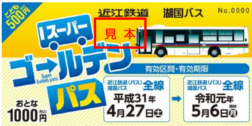
「スーパーゴールデンパス」の券面<見本>