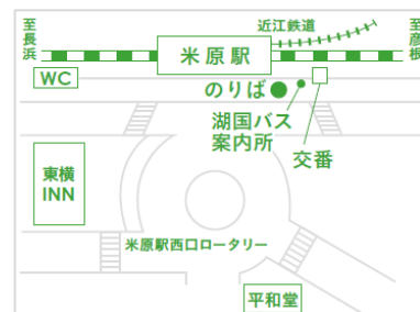
乗り場案内図(米原駅西口)