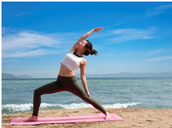
Lakeside Yoga イメージ