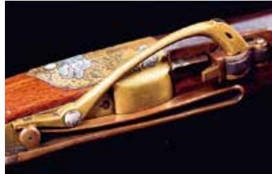
▲国友鉄砲(火挟み部分)