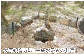
大原観音寺の「三成水汲みの井戸」