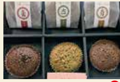
15 常喜家 三献のcha ¥180円+税(要予約) 米原市長岡1180-3 0749-55-0038