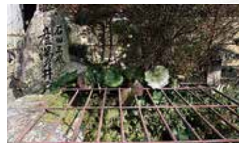
▲「三成産湯の井戸」まで歩いてすぐ

観音寺は、三成が生まれた石田から峠を東に越えた、かつての大原荘内、現在の米原市朝日にある天台宗寺院である（観音坂トンネルを越えてすぐ）。寺内には「三成水汲みの井戸」があり、滋賀県指定文化財となっている600点余りのほろその所蔵文書の中に、石田村の土豪だった石田氏の姿が散見される。