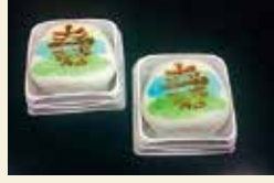
21 いと半老舗 大一大万大吉上用饅頭 ¥150円 彦根市河原三丁目1-20 0749-22-1026