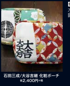
石田三成/大谷吉継 化粧ポーチ 各2,400円+税

ひこね街の駅戦國丸 所彦根市河原3-4-36 電0749275058 開11:00~18:00(変動あり) 休水曜