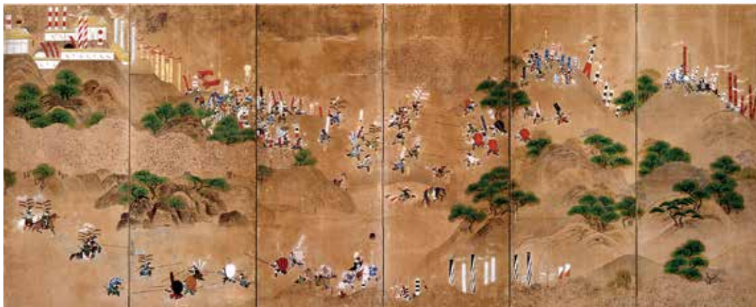
▲関ヶ岳合戦図屏風(右隻、長浜市長浜城歴史博物館蔵)