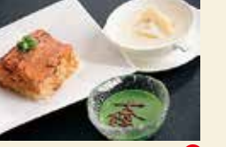
9 長浜ロイヤルホテル 中国料理レストラン 皇帝 琵琶鱈重セット ¥要問い合わせ 長浜市大島町38 0749-64-2000