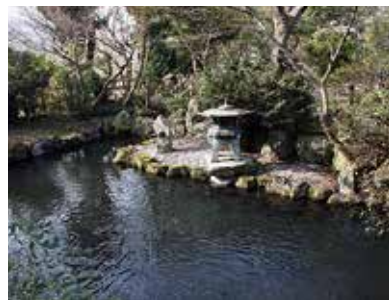
▲石田会館横の「治部池」

現地を訪れると「石田治部少輔出生地」と刻まれた碑と石田三成像が迎えてくれる。石田会館では三成の事跡をパネルなどで紹介している。 石田に残る小字名「治部」は三成の官途「治部少輔」から命名されたもので、その「治部」の南西端に「掘端」あるいは「治部池」と呼ばれる小さな池があり、石田屋敷の堀の一部であると伝えられている。石田家は、土豪とか地侍とか呼ばれる「村の武士」であった。