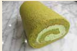
3 手づくり工房 みゆう 三献の茶ロール ¥1296円(数量限定) 長浜市高月町落川18-1 0749-85-2111