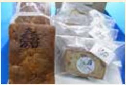
24 洋菓子工房 バニラビーンズ 干し柿とクルミのパウンドケーキ ¥680円 彦根市本町一丁目7-34(四番町スクエア彩茶館内) 0749-27-4095