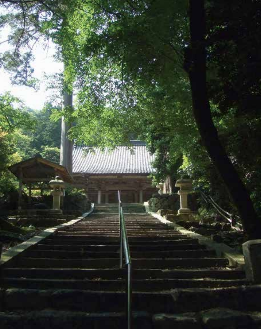
▲「三成水汲みの井戸」がある大原観音寺