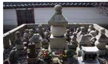
▲八幡神社に安置されている供養塔