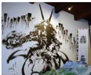
▲石田三成の墨絵(墨絵師 御歌頭)と佐和山城のジオラマ