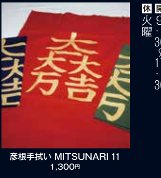
彦根手拭い MITSUNARI 11 1,300円