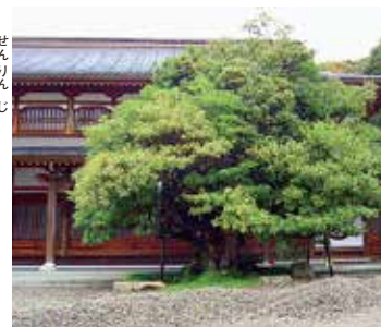
▲清涼寺七不思議の一つ、儂げな女人に姿を変えるというタブノキ