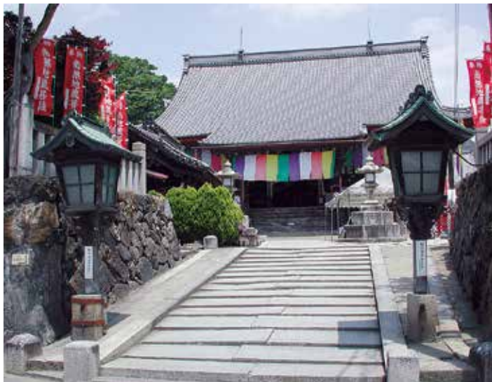
▲関ヶ岳合戦時に秀吉の本陣となった木之本地蔵院