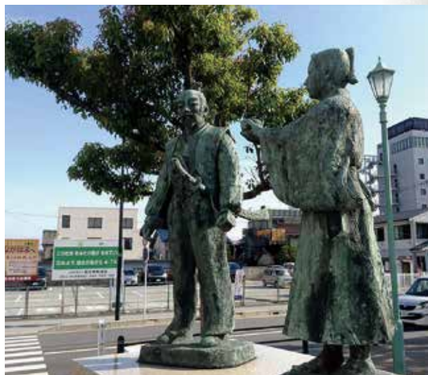
▲秀吉と三成の「出会い」の像