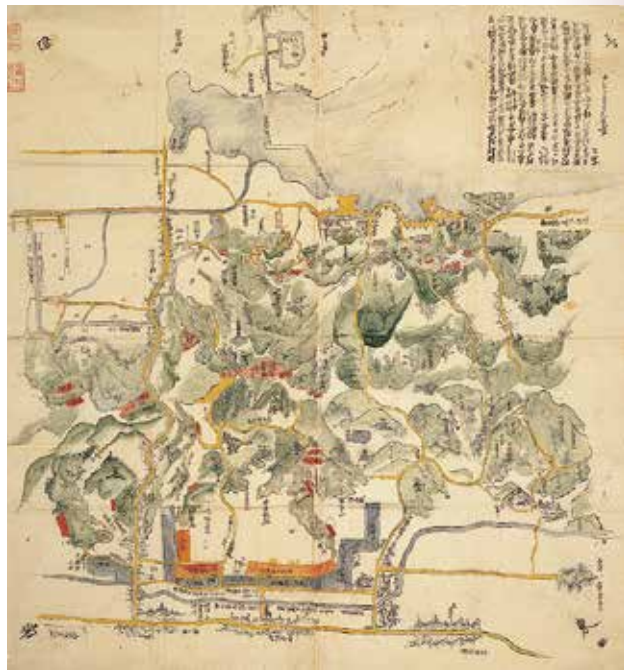
▲佐和山城図 文化11年

かし三成の屋敷は大手の谷とは反対の犬上郡側(彦根市古沢町)のモチノキ谷に建てられていた。