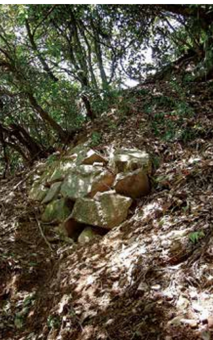
▲佐和山城本丸に残る石垣