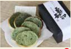
11 ハン工房 ホム・ド・テール 三成の茶らすく ¥700円 長浜市地福寺町11-12 0749-65-6388