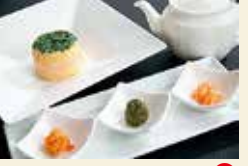
9 長浜ロイヤルホテル 中国料理レストラン 皇帝 三成も食べたかもしれないチャーハン茶漬け ¥要問い合わせ 長浜市大島町38 0749-64-2000