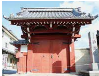
▲佐和山城内の城門だったという妙源寺の「赤門」