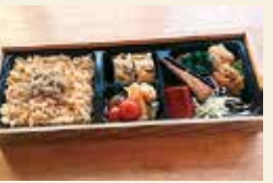
13 Japanese dining 和ow 三茶弁当 ¥1500円+税(要予約) 米原市戸戸1360-1 0749-52-8128

長浜城歴史博物館 ミュージアムショップ 所長浜市公園町10-10 電0749634611 開9:00~17:00 休不定