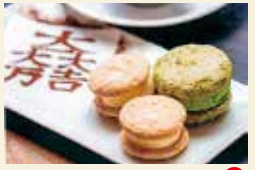
6 黒壁 びわこレストランROKU 抹茶とみそ、2種のプッセ 勝負への思い ¥650円+税 長浜市元浜町11-23 0749-62-6364