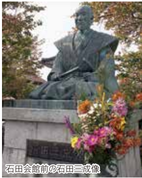
石田会館前の石田三成像