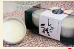
16 かなやキッチン レアな三成 ¥1580円 米原市麗井621-3 0749-54-8139