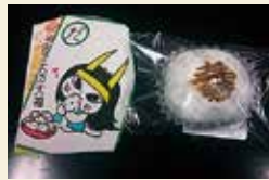
21 いと半老舗 大一大万大吉大福 ¥110円 彦根市河原三丁目1-20 0749-22-1026