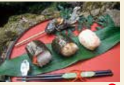
17 旬彩とマス料理 醒井樓 三成三種のにぎりめし ¥900円+税(12名以上から予約受付) 米原市上丹生2054 0749-54-0120