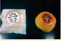
21 いと半老舗 大一大万大吉焼饅頭 ¥150円 彦根市河原三丁目1-20 0749-22-1026