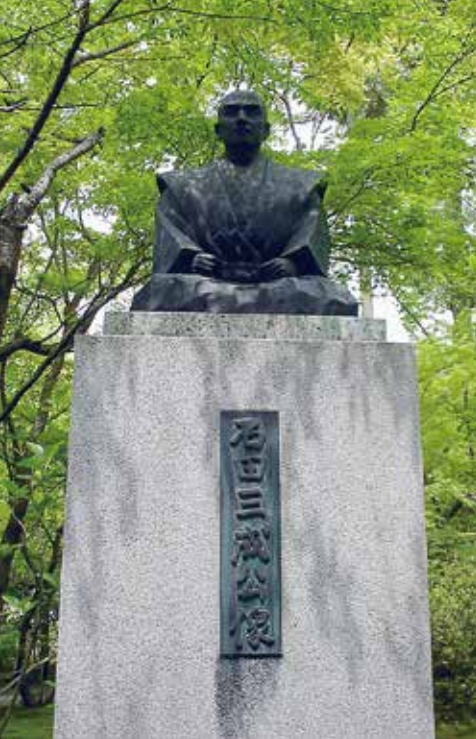
▲龍潭寺の石田三成像