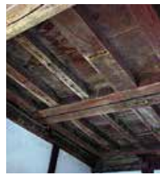
▲佐和山城の用材が使われたという専宗寺太鼓門の天井板

根のもう一つの「赤門」と呼ばれる山門は、佐和山城内の城門であったと伝わる。傷を隠すかのように裏向けて使われている柱材は、解体修理の際に表を向けると無数の矢穴痕が姿を現した。関ヶ原合戦後の東軍による佐和山攻めの激しさを物語っているようでもある。