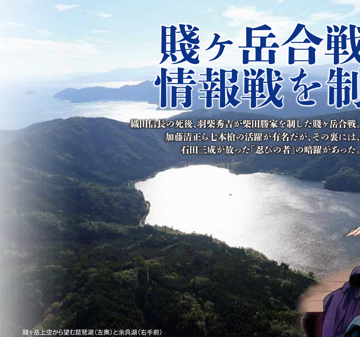
賤ヶ岳上空から望む琵琶湖(左奥)と余呉湖(右手前)

織田信長の死後、羽柴秀吉が柴田勝家を制した賤ヶ岳合戦。 加藤清正ら七本槍の活躍が有名だが、その裏には、 石田三成が放った「忍びの者」の暗躍があった。