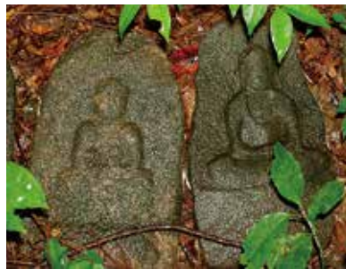
▲仙琳寺の石田地蔵