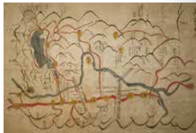
▲関ヶ岳合戦図(長浜市長浜城歴史博物館蔵)