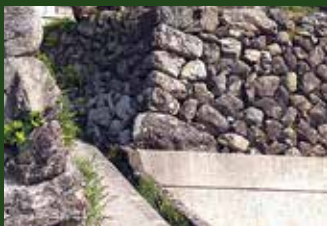
▲古橋に残る三成ゆかりの石垣