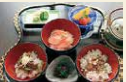
10 北ビワコホテル クラティア 日本料理 竹生島 三献茶漬け ¥1800円+税 長浜市港町4-17 0749-62-7777

夢京橋あかり館 所彦根市本町2-2-3 電07492755001 開9:30~17:30 休火曜