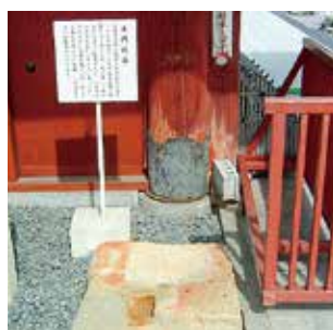
▲宗安寺の「赤門」と礎石

門」が、佐和山城の大手門だという。この寺には、三成が亡き母の菩提を弔うために建立した瑞岳寺(説には鳥居本町笹尾の少林寺に瑞岳寺を移したと伝わる)に祀ってあったという地蔵尊像と千体仏が安置されている。