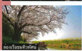
ล่องเรือชมทิวทัศน์