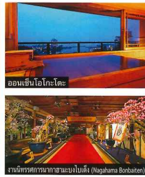
งานนิทรรศการนาฮามาชิโนะบัตัง (Nagahama Bonbaiten)