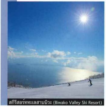
สกีรีสอร์ททะเลสาบบิวะ (Biwako Valley Ski Resort)

แช่ออนเซ็น ทานหม้อไฟก้นเปิดน้ำร้อนๆ ที่จะทำให้อุ่นทั้งกายและใจ เมืองแห่งทะเลสาบอันเขียวสลับที่รอคอยเทศกาลดอกบิวาบาน, ดนบอนไซที่ออกดอกเป็นสีชมพู และลานสกีที่ปกคลุมไปด้วยหิมะในฤดูใบไม้ผลิ