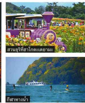
กีฬาทางน้ำ