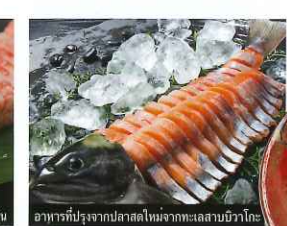
อาหารที่ปรุงจากปลาสดในทะเลสาบบิวาโกะ