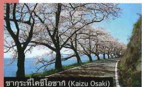
ขบวนที่เคอิโซากิ (Kaizu Osaki)

สามารถเที่ยวชมทัศนียภาพของทะเลสาบบิวาโกะที่ตรงจุดในความทรงจำพร้อมกับเยี่ยมชมถนนสายหลักและเมืองประวัติศาสตร์ที่มีอาคารบานเรือนตั้งอยู่เรียงรายขนาบสองฝั่งแม่น้ำและสามารถเพลิดเพลินไปกับการนั่งเรือชมทิวทัศน์ที่เต็มไปด้วยดอกไม้ซึ่งบานสะพรั่งพร้อมกันได้ที่โอมิเอะจิมัง