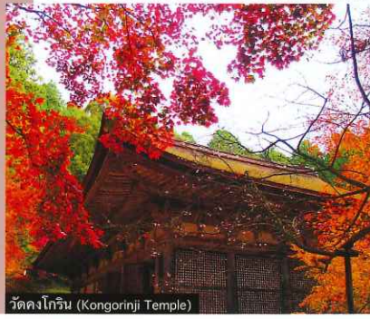
วัดคังโกร็น (Kongorinji Temple)

ไล่สีใบไม้ที่กลายเป็นสีเหลืองและสีแดง ล่องมาเที่ยวชมทะเลสาบบิวาโกะซึ่งเต็มไปด้วยประวัติศาสตร์, วัฒนธรรมและประเพณี ชมเทศกาลต่างๆ รูปปั้นพระพุทธรูปจากหิน และมาชมความสวยงามของใบไม้เปลี่ยนสีกันใหม่