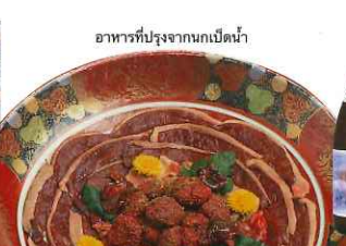
อาหารที่ปรุงจากนกกเป็ดน้ำ