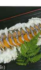
หิมะซูชิ (ซูชิปลาในหิมะ)