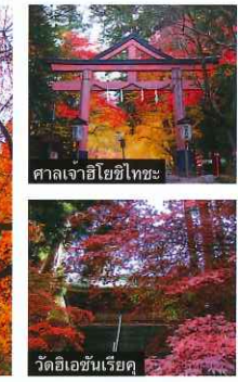
ศาลเจ้าอิชิโทเซะ