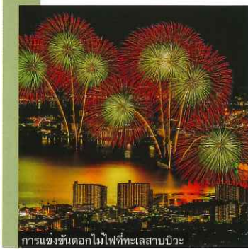
การแข่งขันดอกไม้ไฟที่ทะเลสาบบิวะ

สถานที่ท่องเที่ยวและจุดที่น่าสนใจของทะเลสาบบิวาโกะในหน้าร้อนมีมากมาย เช่น การเดินชมดอกไม้บานริมฝั่งแม่น้ำ, และการล่องเรือไปตามแม่น้ำ, กีฬาทางน้ำ เช่น วินเซิร์ฟ, การเล่นเรือใบ เป็นต้น