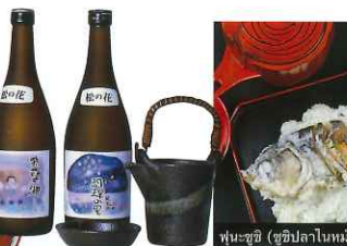
เหล้าพื้นบ้าน