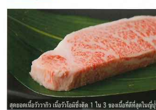
สุกเนื้อวัวกว่ากิโล เนื้อวัวโอมิซึ่งคิด 1 ใน 3 ของเนื้อที่ตัดที่สุดในญี่ปุ่น

จังหวัดชิงะที่พร้อมและอุดมสมบูรณ์ไปด้วยธรรมชาติ มีวัตถุดิบสดใหม่ ไม่ว่าจะเป็นไข่ปลา, นกเป็ดน้ำ, เนื้อวัวโอมิ และปลาในทะเลที่จับได้จากทะเลสาบบิวาโกะ ฯลฯ อิ่มเอมไปกับรสชาติแห่งทะเลสาบบิวาโกะโดยเพลิดเพลินไปกับรสชาติและอาหารมากมาย