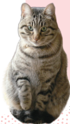
初代こにゃん市長 ぎん