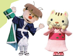
いしべえどん® こにゃん®