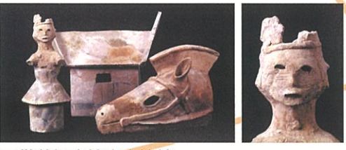
■ 供養塚古墳出土埴輪