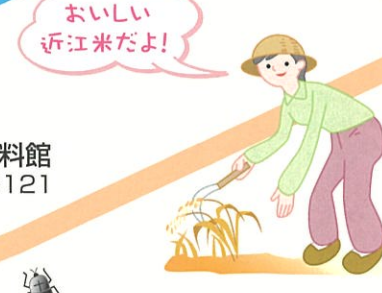
おいしい 近江米だよ!