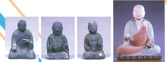
■ 椿神社神像 千僧供町所有(栗東歴史民俗博物館へ寄託)