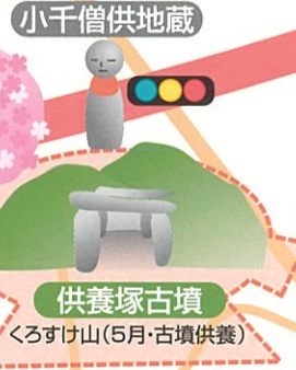
供養塚古墳 くらすけ山(5月・古墳供養)

千僧供町豆知識 2 古墳は古墳時代の遺跡であるが、名のもととなった住蓮房は安楽房と共に鎌倉時代の浄土宗元祖法然上人の弟子であった。住蓮、安楽の処刑された物語は、語り継がれ江戸時代に二僧の墓が古墳上部に建てられた。