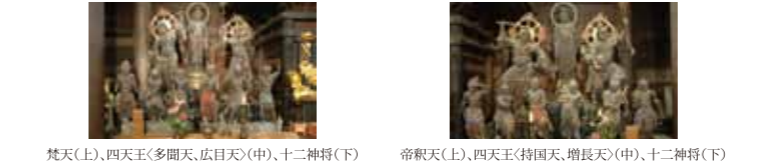
梵天(上)、四天王(多聞天、広目天)(中)、十二神将(下)